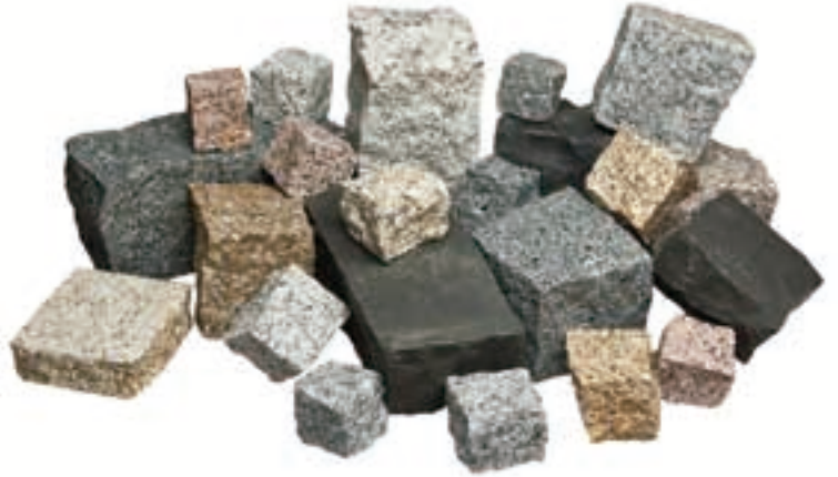
TABLA DE RENDIMIENTO